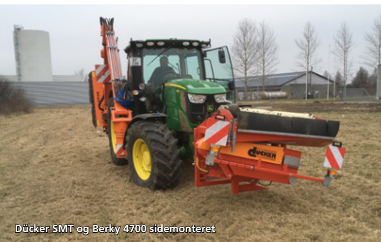
Dücker SMT og Berky 4700 sidemonteret

»Front- eller sidemonteret klippeudstyr.«