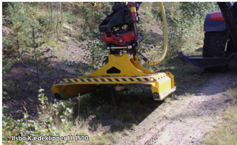
Ilsbo Kædeklipper H 1500