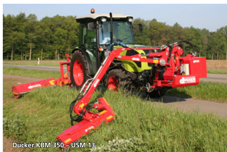
Dücker KBM 350 – USM 13