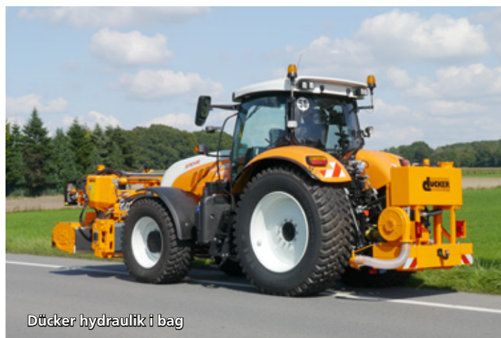
Dücker hydraulik i bag

»Vi tilbyder også slagleklipper, knuser, brostensbørste, gren- og hækkeklipper, savklinger, grøfterenser og dobbelt fingerklipper«.