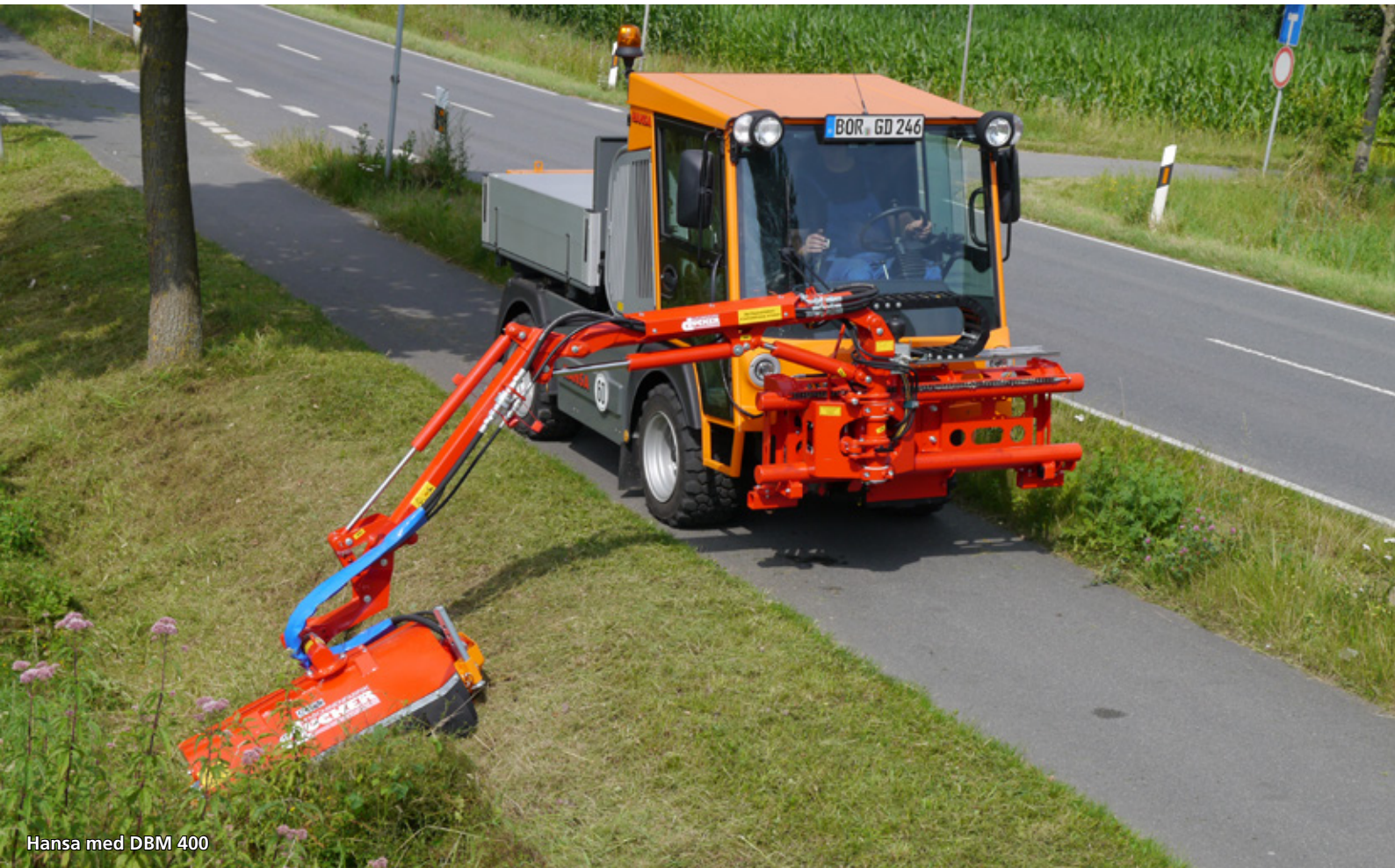
Hansa med DBM 400

»Vi tilbyder også slagleklipper, knuser, brostensbørste, gren- og hækkeklipper, savklinger, grøfterenser og dobbelt fingerklipper«.