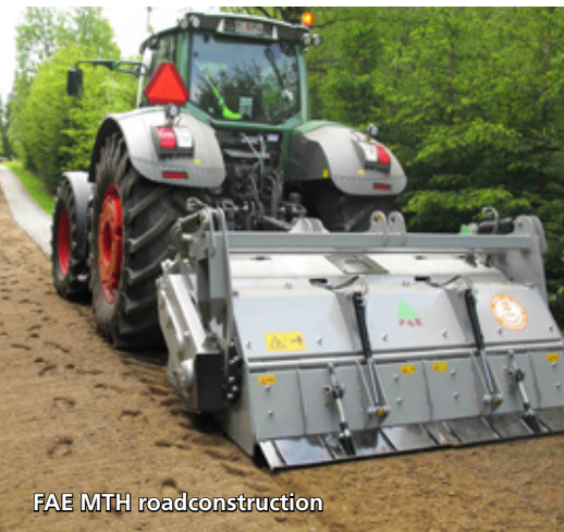
FAE MTH roadconstruction