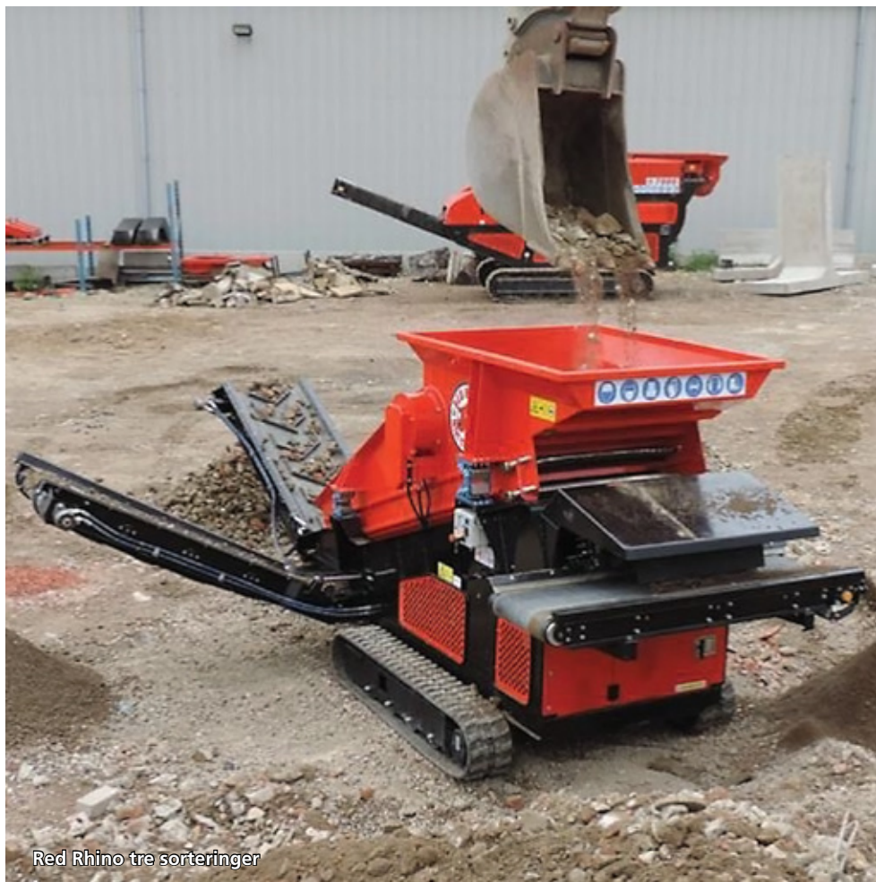
Red Rhino tre sorteringer