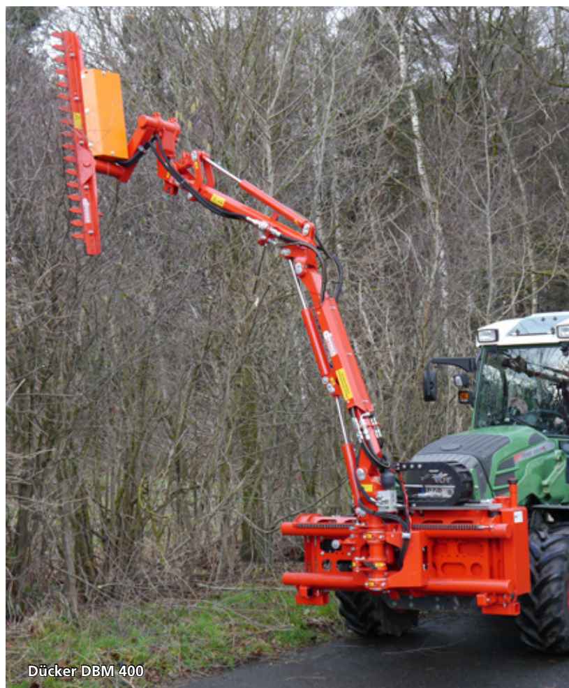
Dücker DBM 400