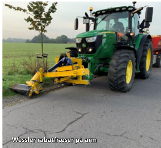
Wessler rabatfræser på arm

»Maskiner til forskellige løsninger af vejvedligeholdelse«.