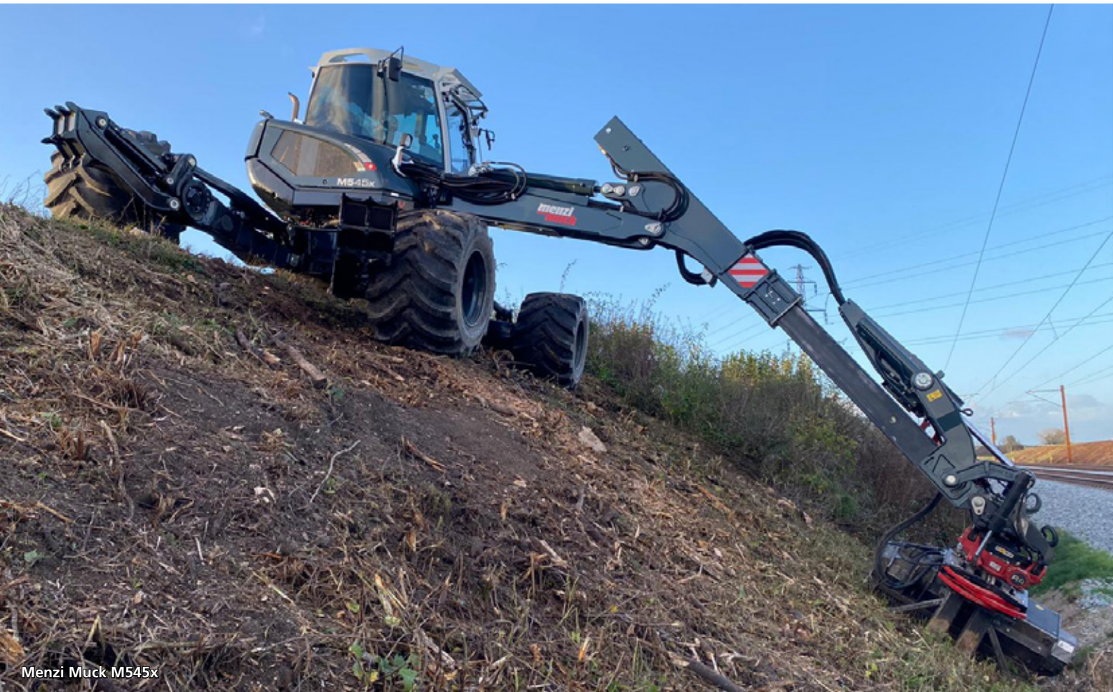
Menzi Muck M545x