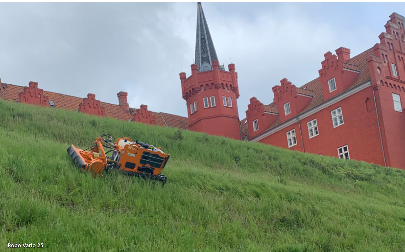
Robo Vario 25