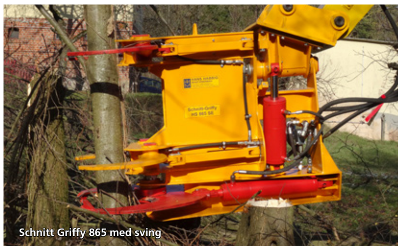
Schnitt Griffy 865 med sving