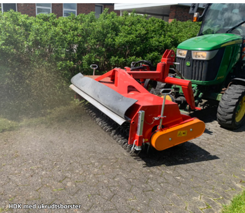
HDK med ukrudtsbørster