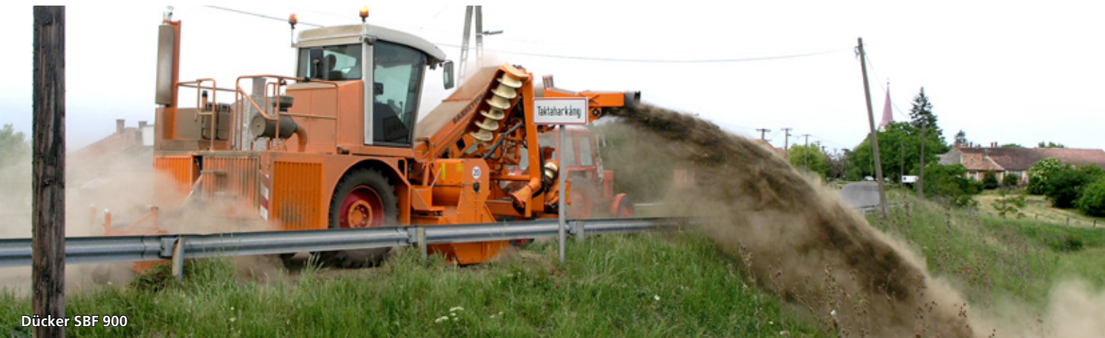
Dücker SBF 900