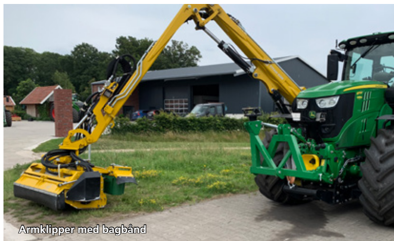
Armklipper med bagbånd